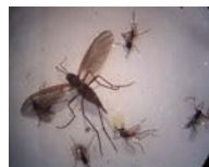
クロバネキノコバエ