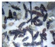
ハネカクシ (大発生)